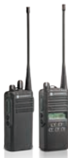
SERIE EP350 MX

También soportan accesorios de audio Mag One™, que proporcionan una opción económica para los usuarios de radio de uso ligero.