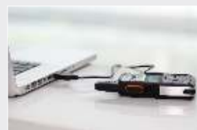
Carga mediante micro USB