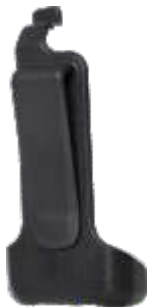
Clip para cinturón (PD366)