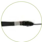
Correa de nailon