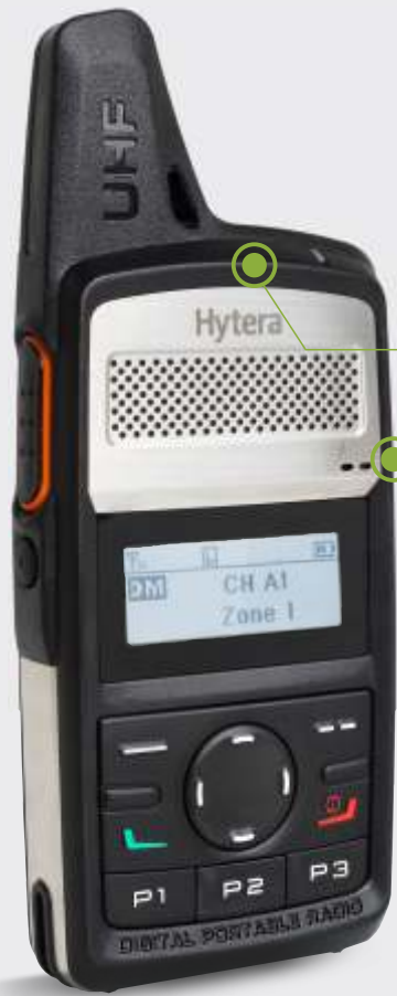
Diseño de bolsillo