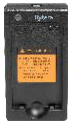
Cargador rápido (batería de Li-Ion) CH10L20