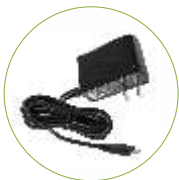
Adaptador micro USB (5V/1 A)